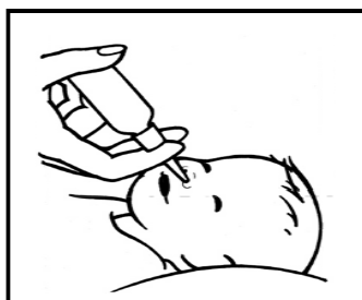
Podanie dawki dziecku w pozycji leżącej